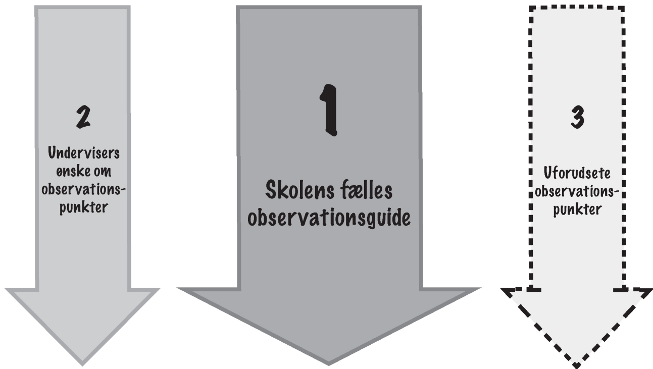
Figur 3.2. De tre spor i skoleleders observationsfokus.